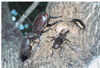
15. カブトムシやクワガタムシ類