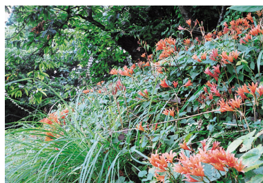
17. キツネノカミソリ