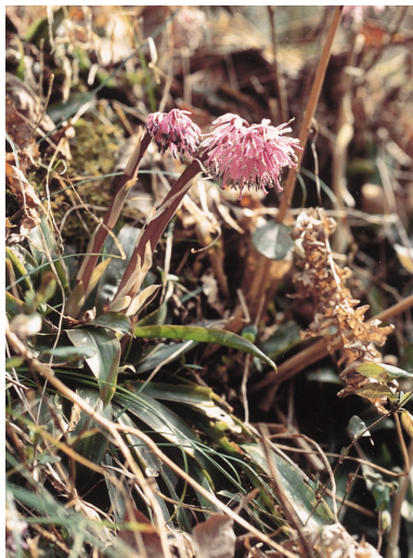
20. ショウジョウバカマ